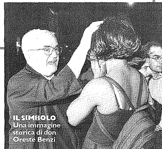
IL SIMBOLO Una immagine storica di don Oreste Benzi

che collaborerà con l'associazione Cure2children, non si limiterebbe a curare e seguire i bambini, ma penserebbe anche a formare medici e infermieri stranieri in modo che possa crescere il livello qualitativo della sanità nei paesi di provenienza. Presente ieri anche il ministro della Sanità Claudio Podestini. «Crediamo in questo progetto - ha detto il ministro - e vogliamo collaborare attraverso le nostre strutture e il personale, per aiutare la buona riuscita di questa iniziativa».